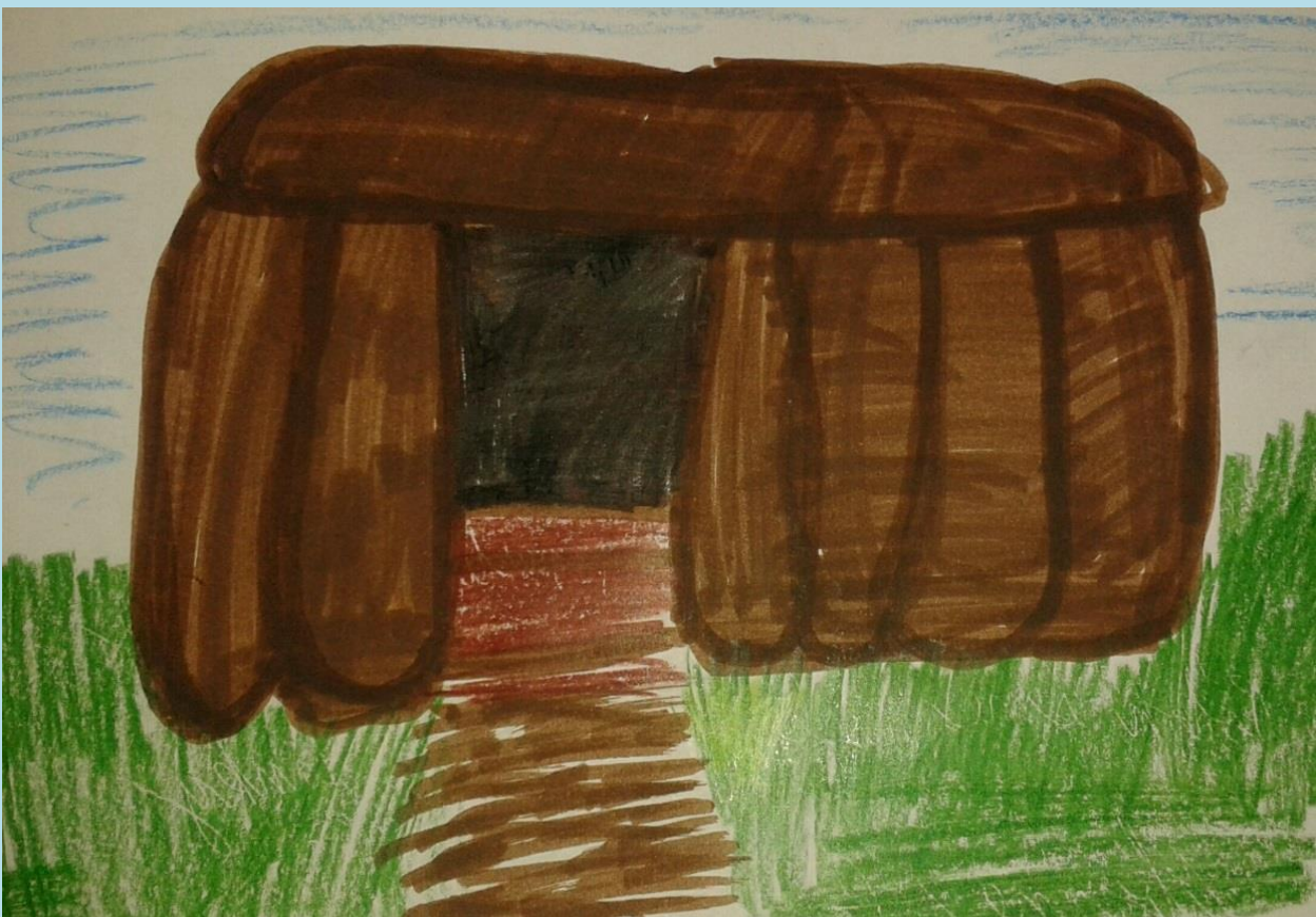
ILUSTRÁCIA, EVA PULLMANOVÁ, 4. B