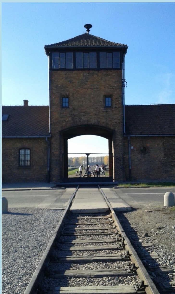
BIRKENAU, FOTO M. ČURLÍKOVÁ

Práca oslobodzuje. Tak znie motivačné heslo nad vstupnou bránou do komplexu červených tehlových budov najskôr koncentračného, potom vyhladzovacieho tábora Osvienčim – Brezinka (v nemčine Auschwitz – Birkenau), ktoré sa v slnečnom jesennom dni strácajú medzi zlatožltými listami stromov. Návštevník môže byť zmätený, práve totiž začal prehliadku miesta nepredstaviteľnej hrôzy a najväčšieho utrpenia, aké moderné európske dejiny dosiaľ zaznamenali, a slnečný októbrový deň človeka skôr naladí na jesennú prechádzku. Akoby samotná príroda chcela milosrdne zahaliť zverskosť a krutosť ľudských činov.