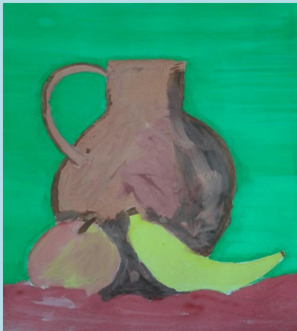
ILUSTRÁCIA KAROLÍNA HUDÁ, 5.C