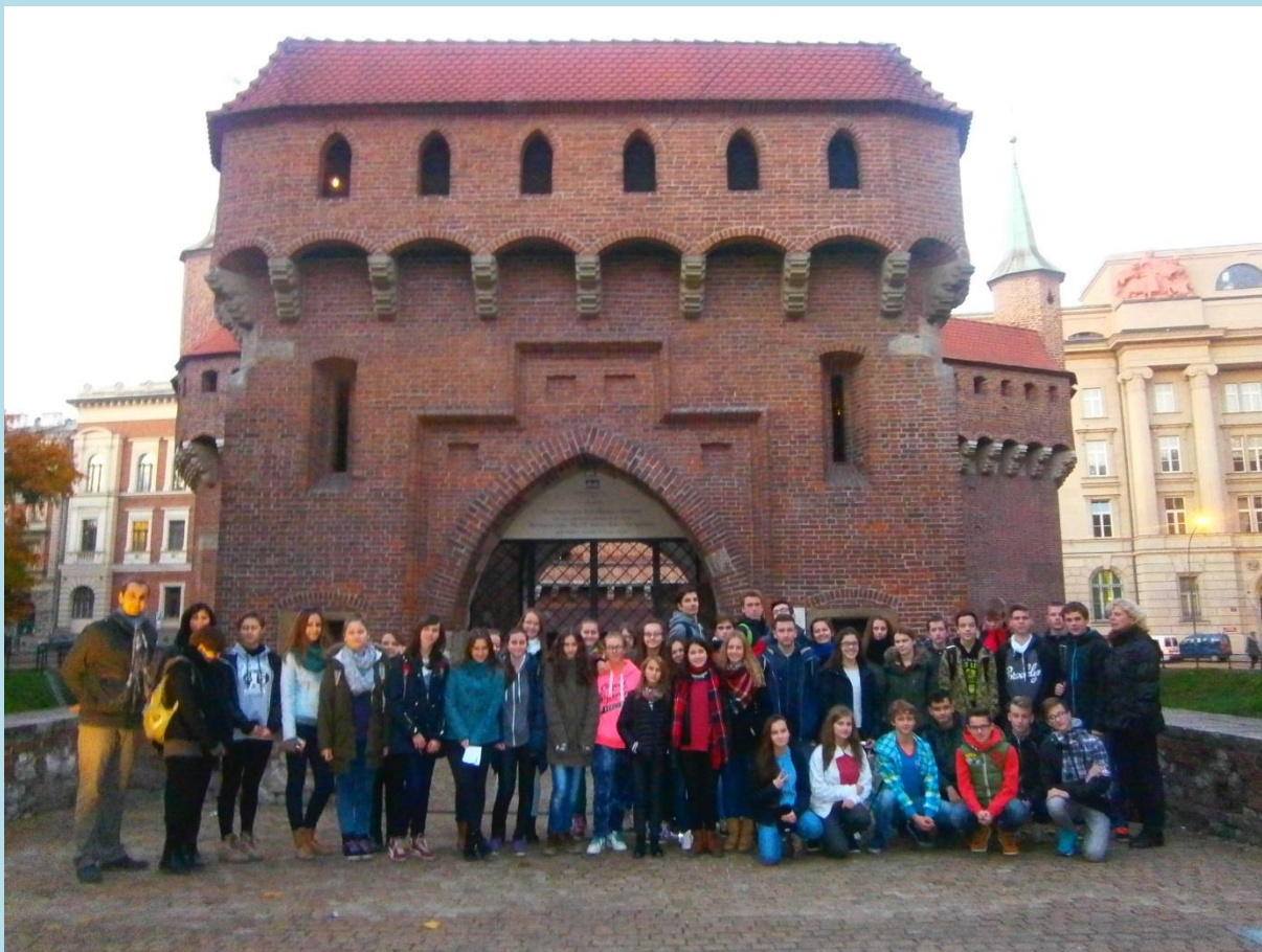
KRAKOW, FOTO T. JAČIŠINOVÁ

Dňa 27. 10. 2015 sme sa my, ôsmaci a deviataci zúčastnili exkurzie Osvienčim - Krakow. Navštívili sme dva koncentračné tábory. Prvým z nich bol Auschwitz 1, vyhladzovací tábor. Druhým bol pracovný tábor Auschwitz – Birkenau. Aj keď sme tam boli len chvíľu, exkurzia bola veľmi zaujímavá a poučná. Vyšli sme aj na strážnu vežu, odkiaľ bol výhľad na celý areál. Po psychickej stránke bola prehliadka dosť náročná. To, čo sme videli, každého z nás chytilo za srdce a aspoň symbolickou sviečkou sme vzdali úctu obetiam holokaustu.