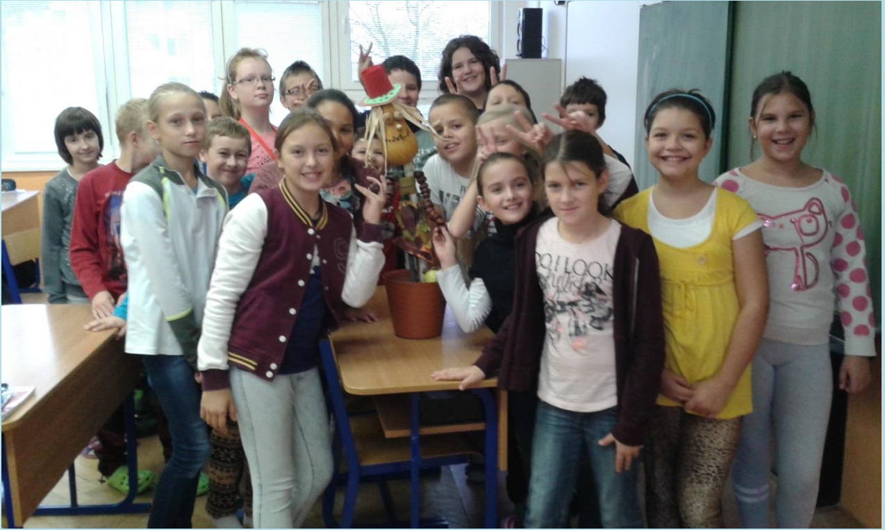
MASKOT ZDRAVEJ VÝŽIVY V 5. A