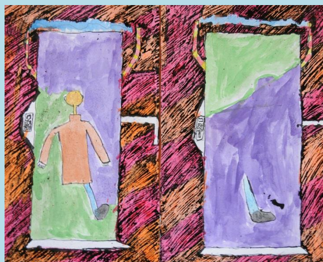
SVET V BUDÚCNOSTI, SAMUEL SATVÁR, 6. C