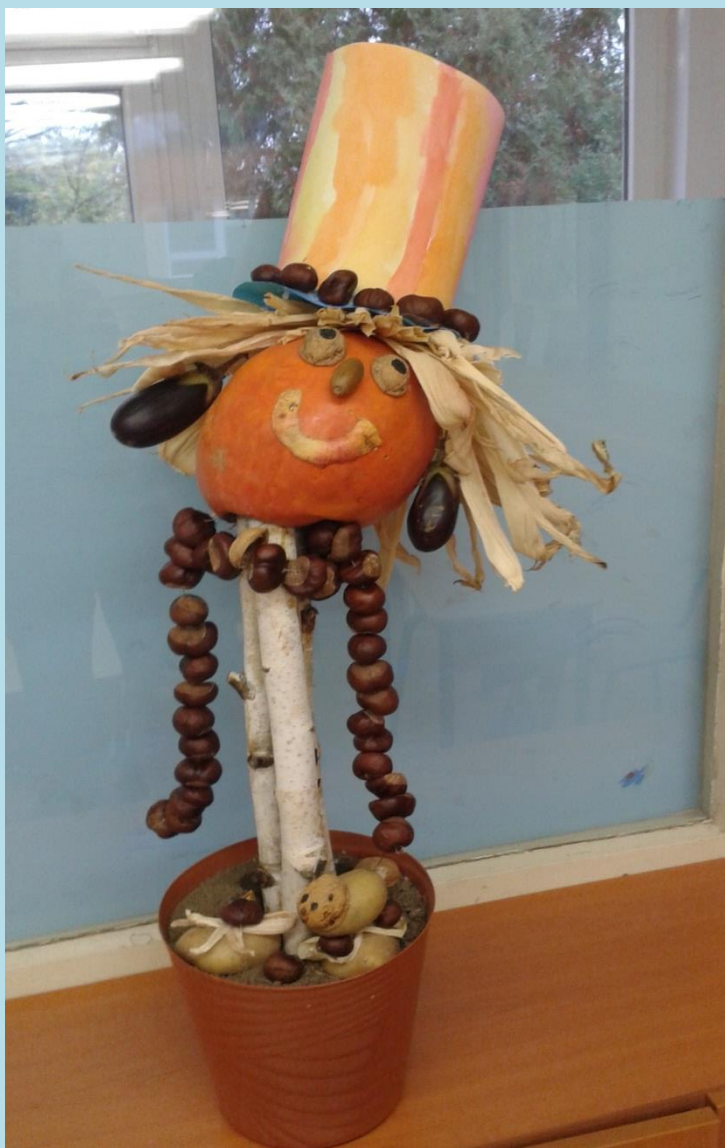
MASKOT ZDRAVEJ VÝŽIVY V 5. C, FOTO M. ČURLÍKOVÁ