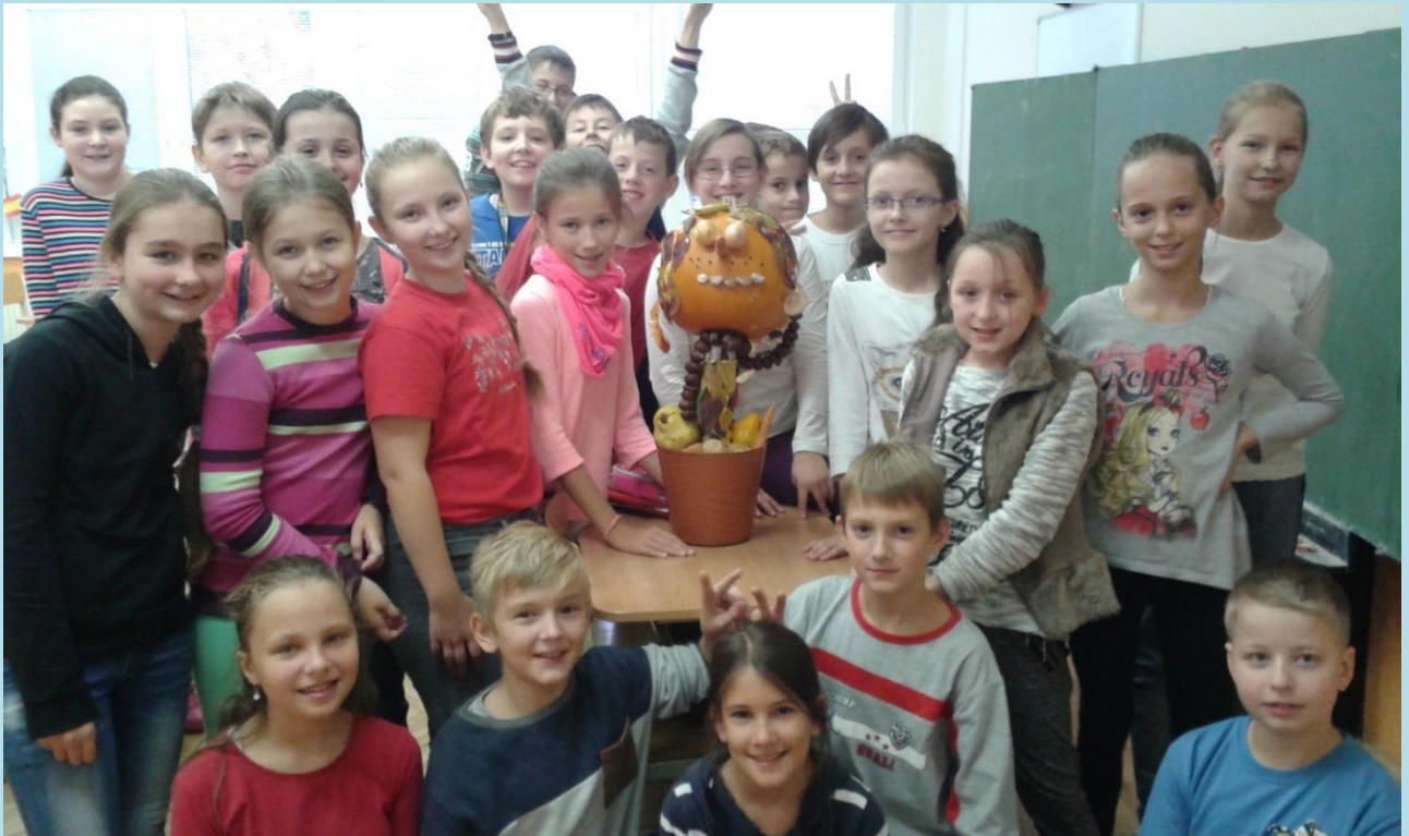
5. B A ICH MASKOT ZDRAVEJ VÝŽIVY

Tvor je to maličký, má čierne zreničky. Úzke teličko má, v črepníku dobre sa mu spáva. Búrky sa on nebojí, len v kvetináči pyšne stojí. Pokojne si tam postáva a na deti žmurká od rána.