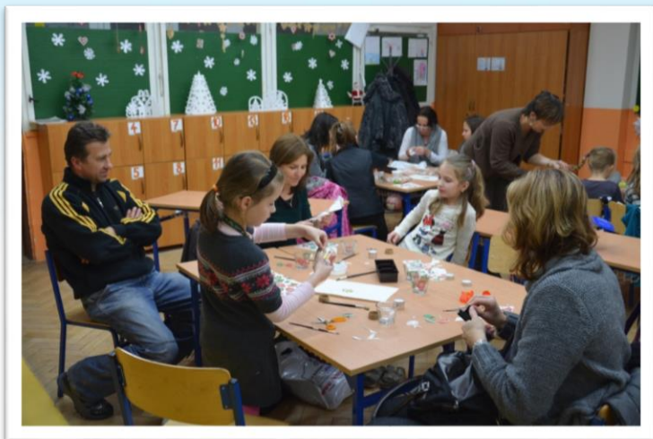
Tvorivé dielne a športové popoludnie

Rodina je najdôležitejší partner školy v posilnení výchovy a vzdelávania našich žiakov