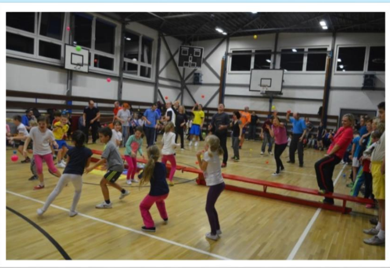
Novoročný športový turnaj