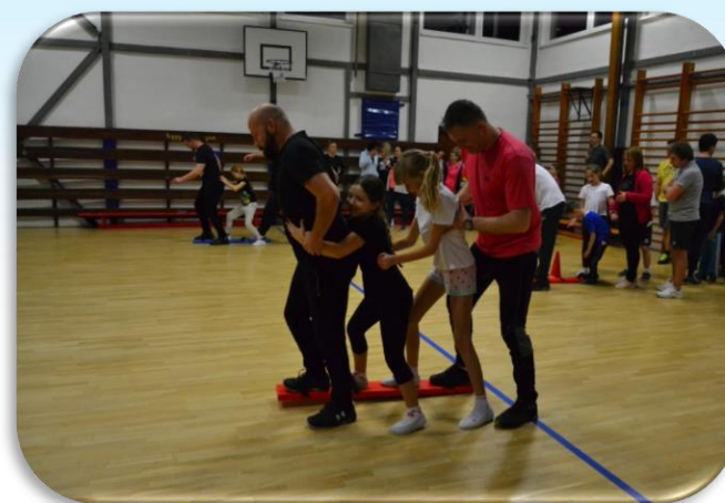
Novoročný športový turnaj